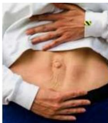
Diástase de retos abdominais

A região abdominal apresenta alterações estético funcionais ao longo da vida, mais frequentes nas mulheres, decorrentes das gestações, variações de peso, sedentarismo, alimentação inadequada e alterações hormonais, em particular durante a gestação.