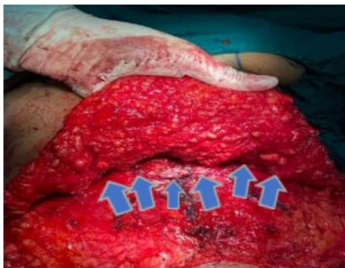
Tração que produzem os pontos de Baroudi

As cirurgias foram realizadas sob anestesia geral ou epidural com sedação. O paciente foi deixado em posição fletida para reduzir a tensão no retalho abdominal. Em todos os pacientes, sendo o uso seletivo de heparina de baixo peso molecular (40 mg durante 7 dias) indicado de acordo com a classificação individual de risco.