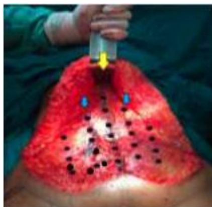
Marcação da aponeurose