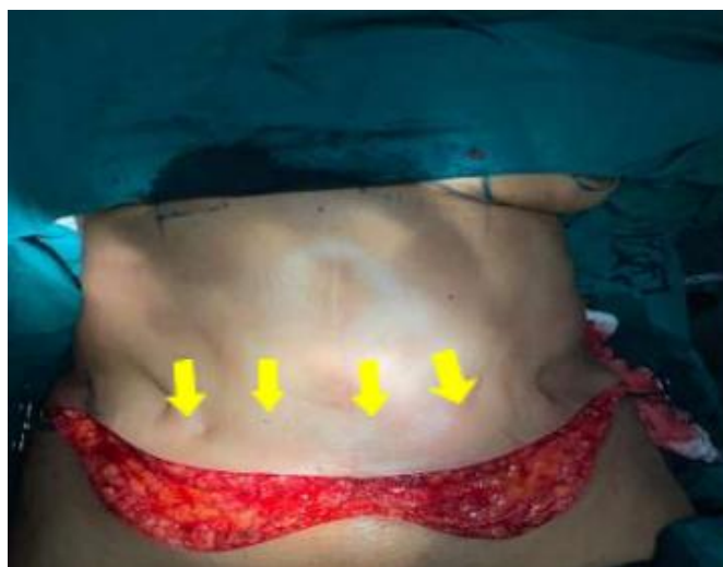
Irregularidades da pele, produzida pelos pontos