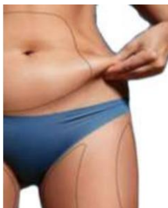
Flacidez e excesso e gordura corporal

As técnicas na abdominoplastia têm sido aprimoradas instaurando-se novas técnicas, como a dissecação limitada do retalho cutâneo, pontos de Baroudi e a lipoaspiração no mesmo ato operatório, com a finalidade de evitar complicações como: seroma, hematoma, deiscência de sutura, necroses de pele, cicatrizes hipertróficas, quelóides e cicatriz pubiana alta. É do interesse do novo cirurgião, utilizar essas técnicas em nosso dia a dia, para prevenir futuras complicações.