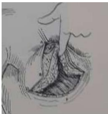
Figura 4- técnica de pedículo superior

Os retalhos dermoglandulares medial e lateral foram dissecados na metade inferior do parênquima mamário não estendidos, além do sulco inframamário. Uma bolsa subglandular é gerada por dissecção acima da fáscia peitoral para criar um espaço, para que o implante se acomode facilmente, ou submuscular se a opção for por implante dual plane. A dissecção é feita com preservação dos ligamentos mamários laterais superficiais e profundos. Essa manobra possibilita a mobilização medial da parte lateral da nova mama. O retalho parenquimatoso recebe sua circulação sanguínea tanto da artéria torácica interna, quanto torácica lateral, dos ramos toracoacromiais e ramos mamários laterais. O volume do implante quando associado é determinado para cada paciente com base no tamanho do corpo desejado e nas medidas da mama/torácica (largura e altura da base da mama, circunferência torácica, distância fúrcula esternal ao mamilo, distância mamilo-mamilo e mamilo-IMF ). A opção por próteses menores que 300ml é via de regra aconselhada para evitar sobretensão nas suturas e ptose mamária precoce. A incisão do CAP é fechada com suturas de nylon 4/0 (nylon) com o tipo Gilles- Perseu. A montagem dos pilares mamários medial e lateral juntos sobre o implante (ou não usando implantes) é feito com nylon 2-0. Para fecho subcutâneo procedeu-se a sutura em chuleio com monocryl 3-0.