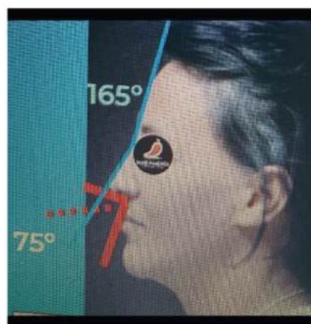
Fig. 03 – Ângulo Nasolabial e Fronto-nasal

O importante é não passar de 115^\circ para evitar de ficar com aspecto de “nariz de tomada”, também conhecida como “nariz de porco”. Desta forma, ao aumentar o grau de um ângulo, automaticamente você vai diminuir o outro ângulo. Então sempre deve-se levar em consideração que o fronto-Nasal precisa ficar entre 120^\circ a 130^\circ e o nasolabial, no homem de 90^\circ a 105^\circ , e na mulher entre 105 e 115^\circ . Observe a Figura 03 que o ângulo Nasolabial está com 75^\circ e o ângulo Fronto-nasal com 165^\circ .